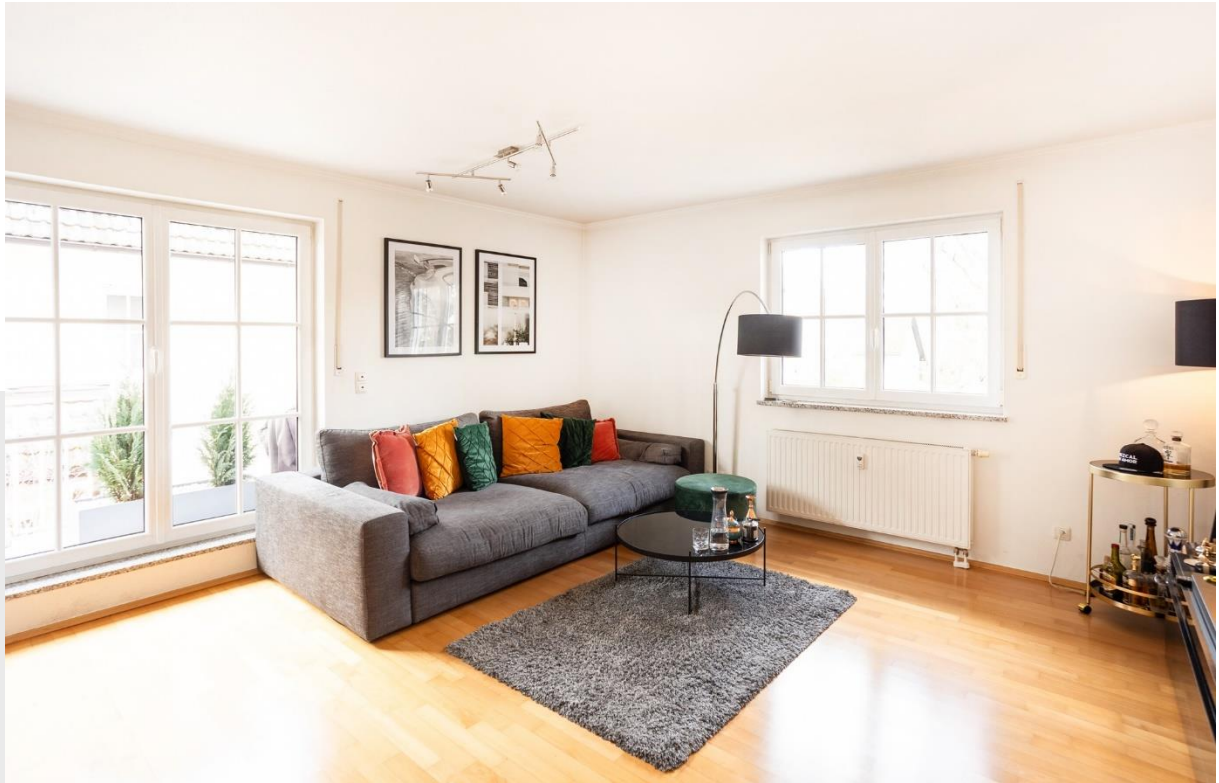
Wohnzimmer mit Zugang zum Balkon