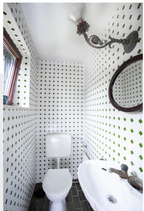
Gäste- WC im Retro-Stil