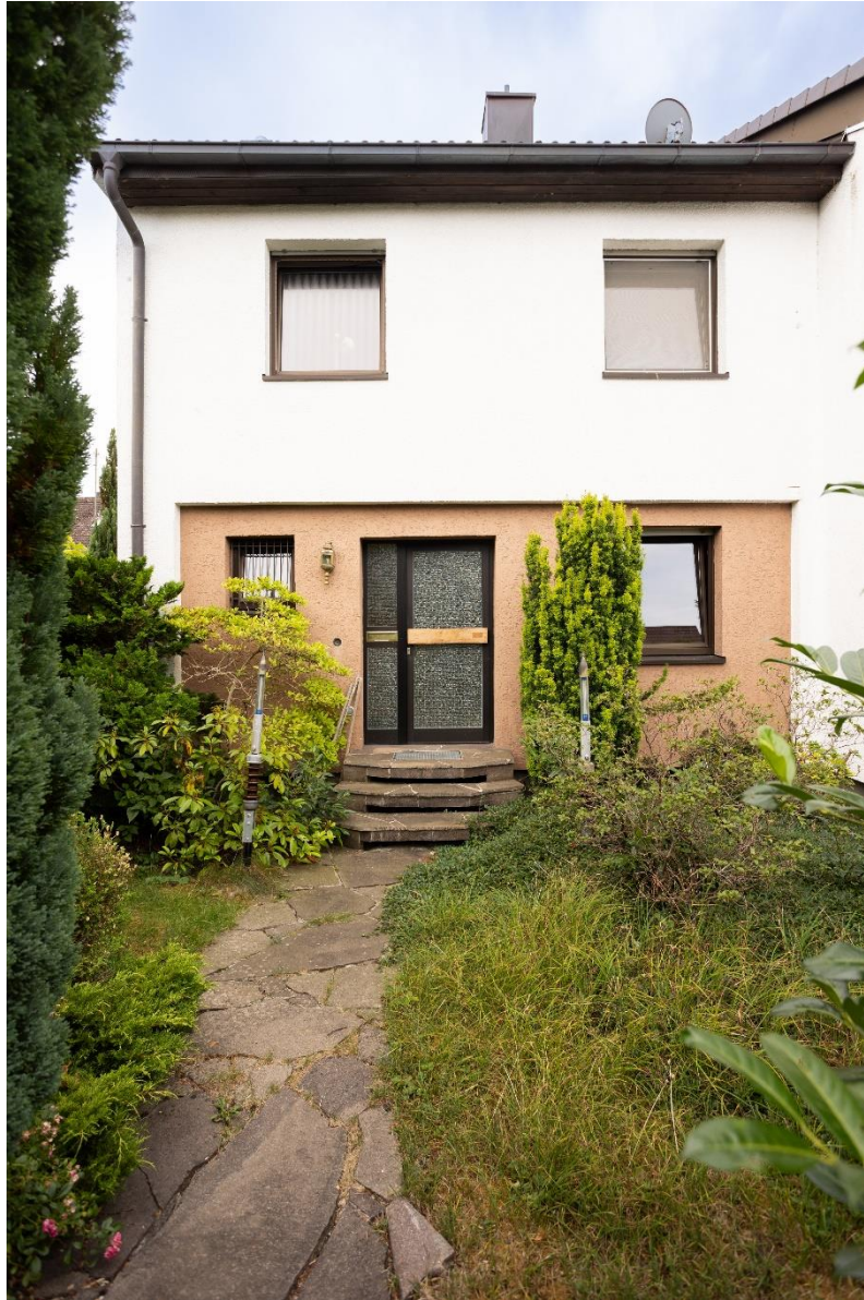
Hauseingang mit Vorgarten