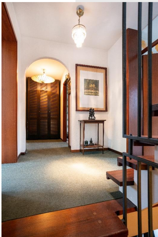
Diele im 1. OG