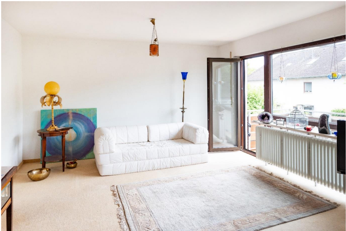
Schlafzimmer im OG mit Balkon