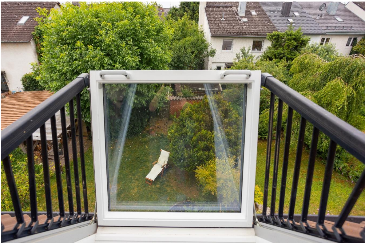
Ausblick vom Dachaustrittsfenster