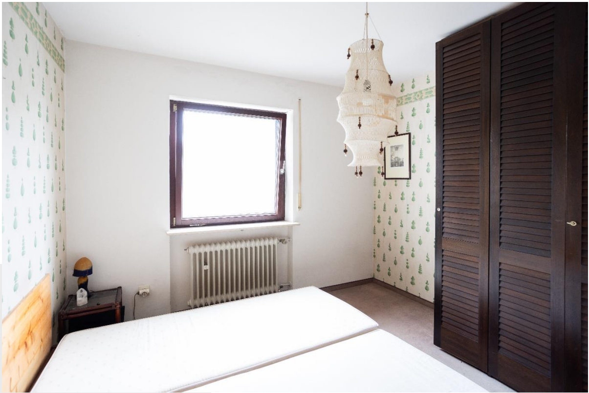
Kleines Schlafzimmer im OG