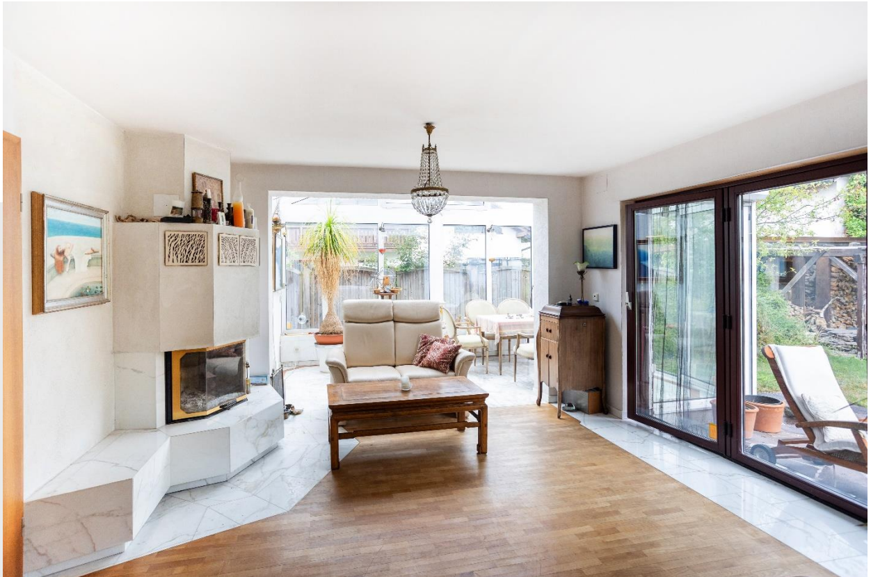
Wohnzimmer mit Zugang zur Terrasse und Wintergarten