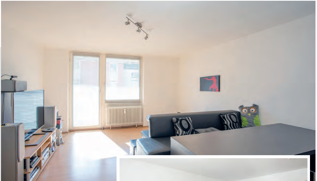
Wohnzimmer mit Balkonzugang