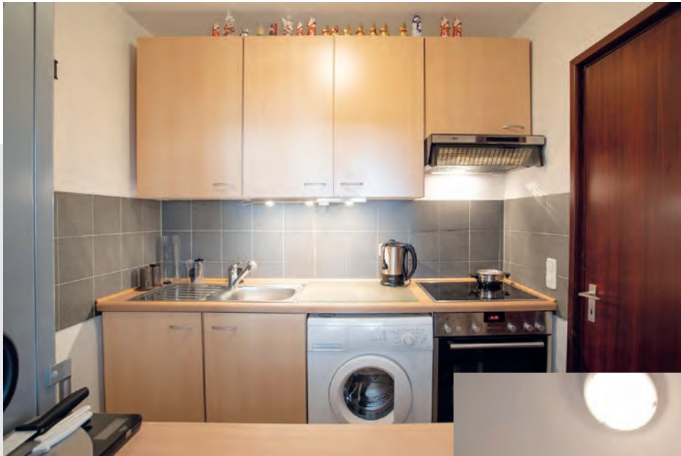
Einbauküche mit Waschmaschine