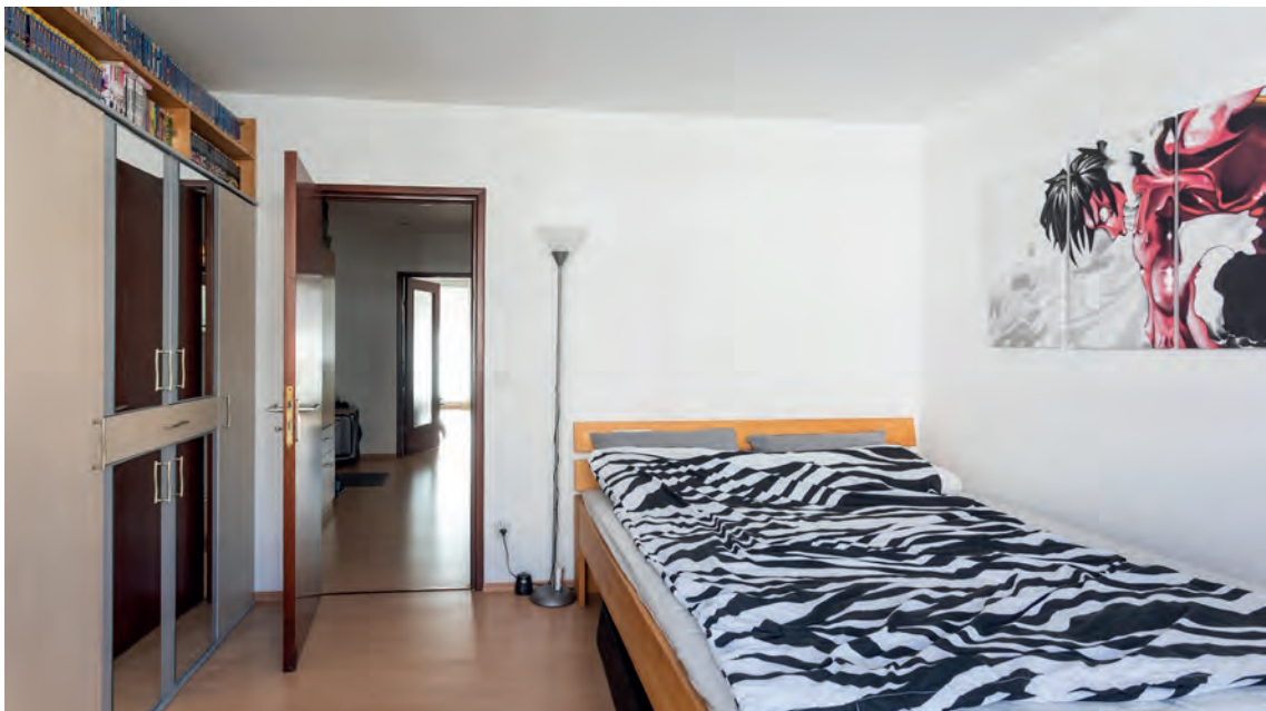
Blick in den Flur