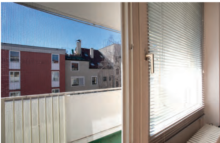
Südbalkon mit Überdachung