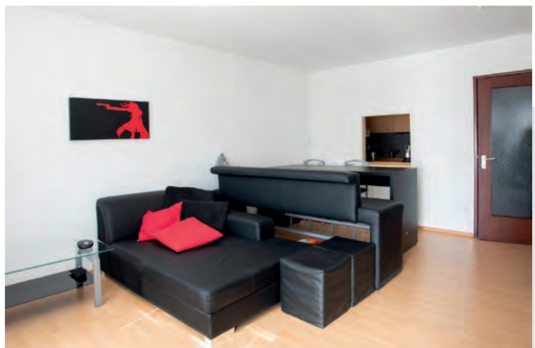
mit Durchreiche zur Küche