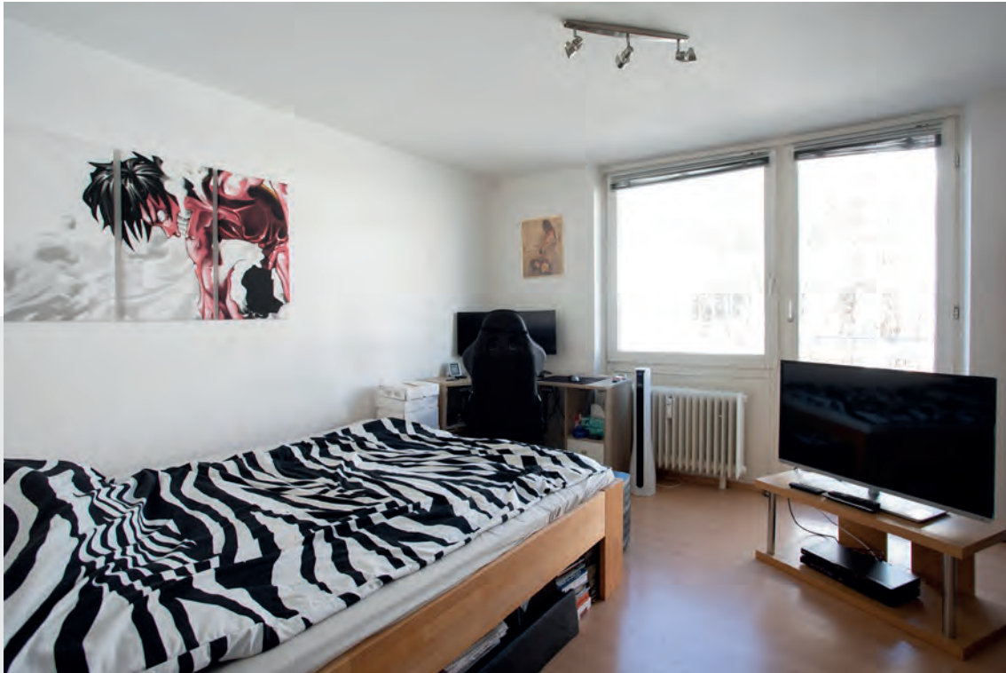
Schlafzimmer mit großem Fenster