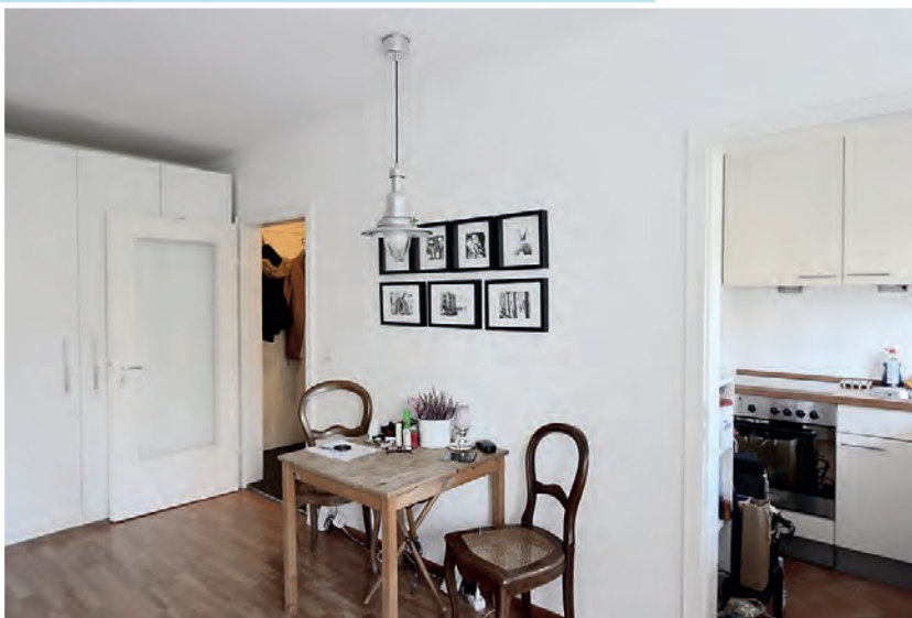
Blick in Küche und Diele Platz für einen großen Schrank

Das Hausgeld beträgt Euro 107 und beinhaltet die Rücklagen. Die Wohnung ist seit 2012 an eine zuverlässige junge Frau für eine Nettokaltmiete von Euro 430 vermietet. Die gesetzliche Kündigungsfrist beträgt 6 Monate.