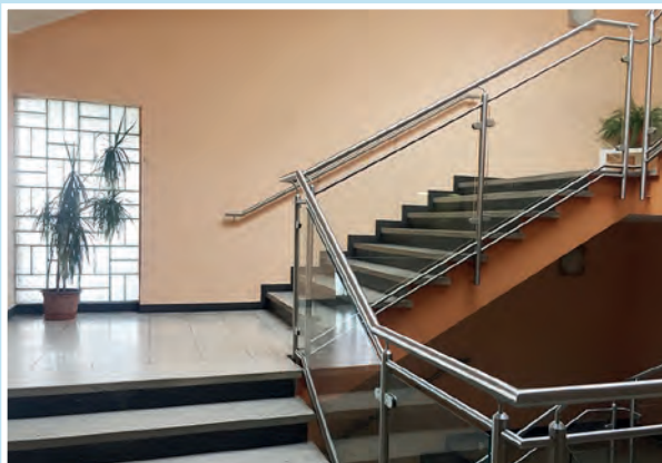
modernes, helles Treppenhaus