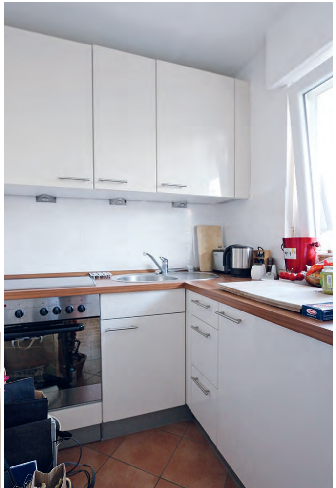
neuwertige, separate Einbauküche